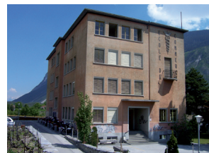
École de commerce et de culture générale (ECCG) Siders

secretariat@ecsion.eduvs.ch www.ecsion.ch