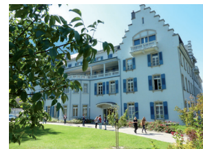
Oberwalliser Mittelschule (OMS) St. Ursula Brig Handels- und Fachmittelschule