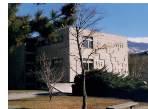
École de commerce et de culture générale (ECCG) Sitten

secretariat@eccgmartigny.ch www.eccgmartigny.ch