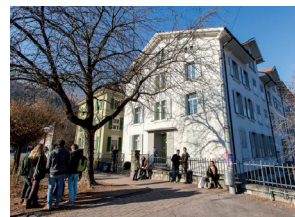
École de commerce et de culture générale (ECCG) Monthey