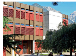
École de commerce et de culture générale (ECCG) Martinach

secretariat@eccgmartigny.ch www.eccgmartigny.ch