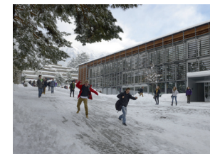
SPORTSCHULE Kollegium Spiritus Sanctus Brig

sekretariat@spiritus.ch www.spiritus.ch/sportschule